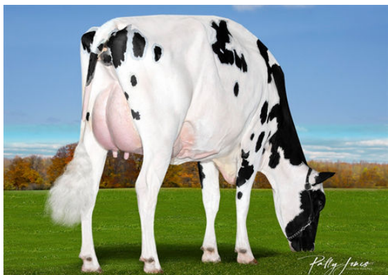
VOGUE REDEYE LOVE AFFAIR-P DAUGHTER